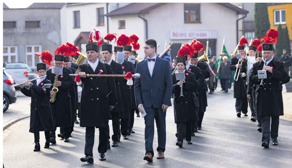
Przemarsz ulicami miasta poprowadziła Orkiestra Dętą PAK KWB Konin