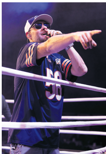
Koncert TEDE zakończył galę boks